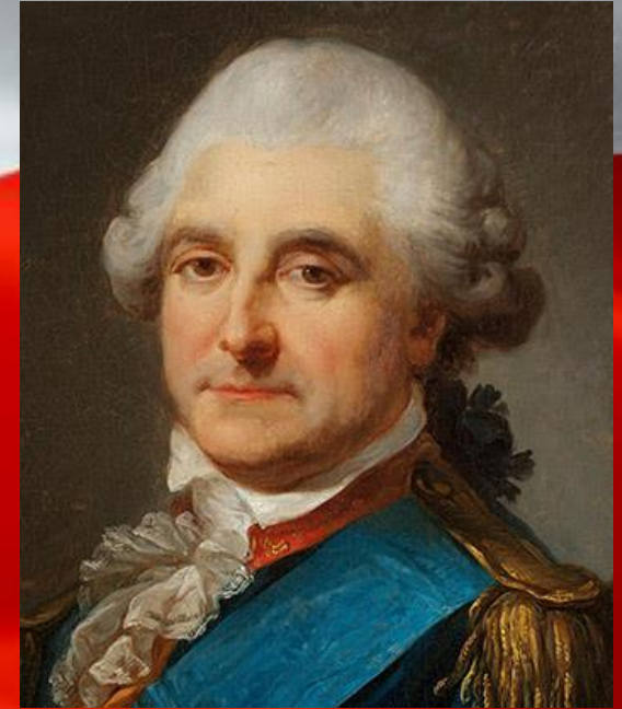
Stanisław August Poniatowski