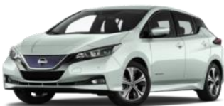
elektryczny Nissan Leaf